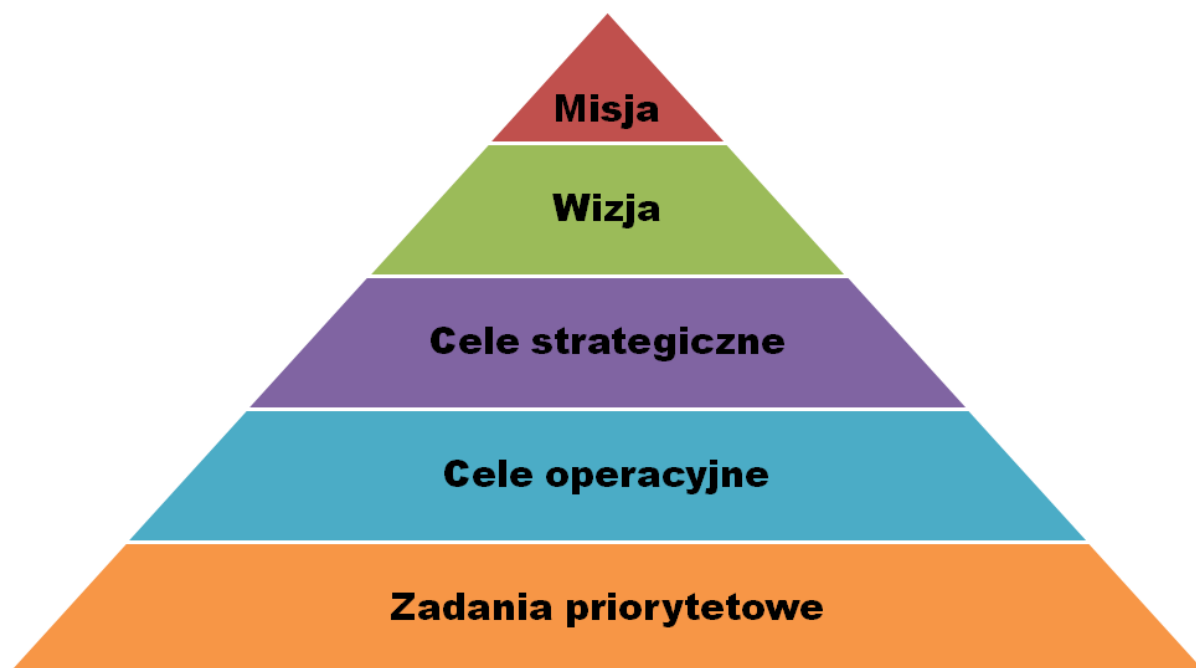
Rys. II.1. Hierarchiczny układ poziomów planowania przyjęty w Strategii

Plany dotyczące dalszej działalności przedstawiono z zachowaniem następującej hierarchii (rys. II.1.)